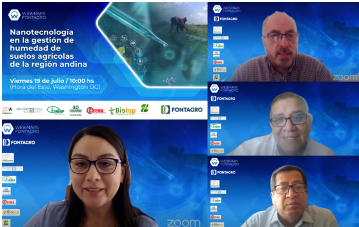
Anexo: Fotografía de los panelistas en la apertura del webinar.