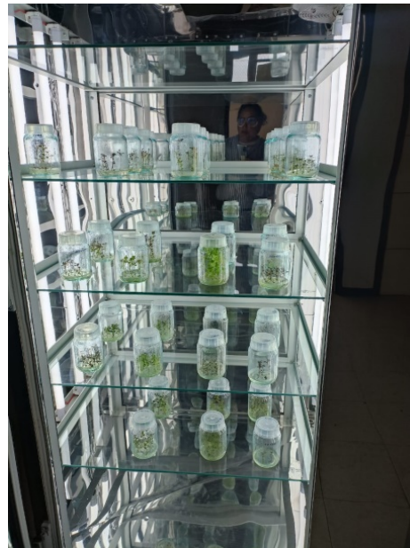
Cámara de termoterapia