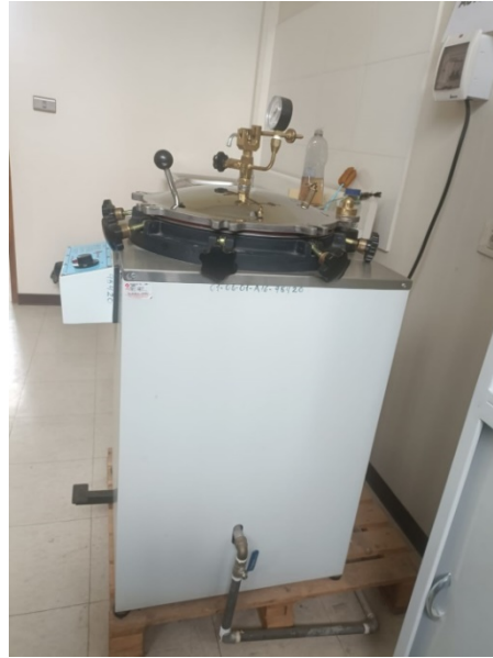
Foto 3 Autoclave