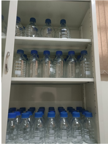
Foto 10 Frascos con tapa azul