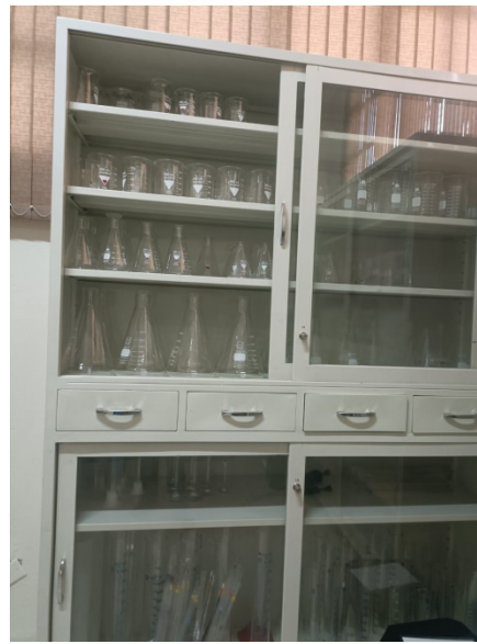
Foto 11 Erlenmeyer, vasos de precipitados