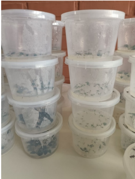
Foto 8 Magentas de plástico