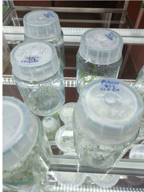
Foto 9 Magentas de vidrio