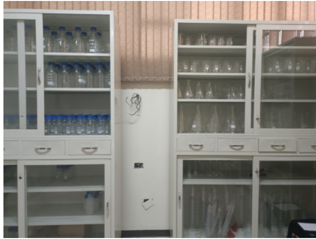
Depósito de materiales de vidrio