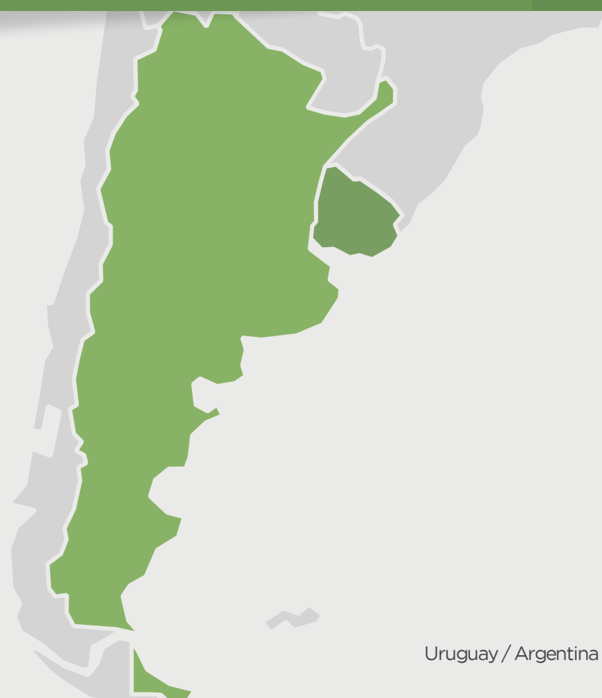
Uruguay / Argentina

Plataforma de Innovación para el pastoreo del campo natural y la sustentabilidad de sistemas ganaderos