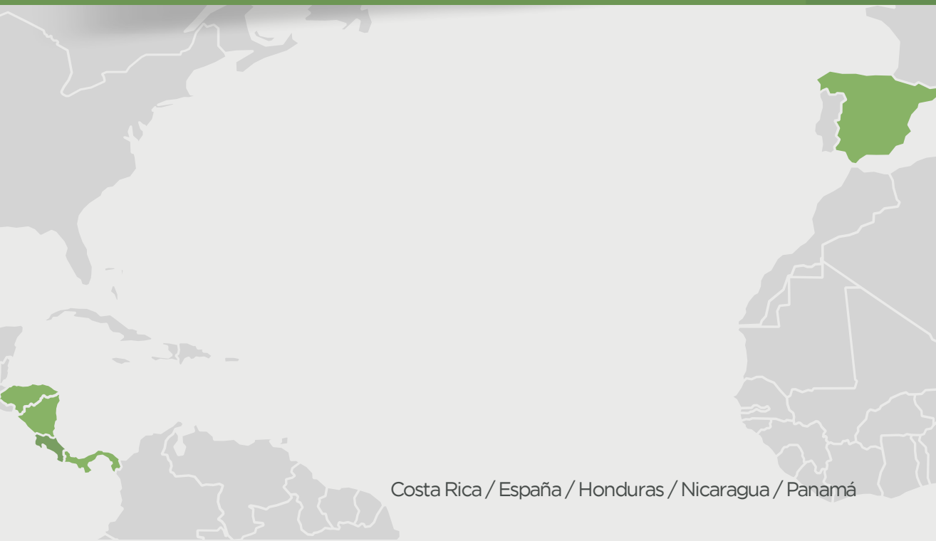
Costa Rica / España / Honduras / Nicaragua / Panamá

Una estrategia de valorización territorial para el estudio técnico y la generación de capacidades, hacia la diferenciación de cacaos finos y de aroma, de origen mesoamericano, mediante la promoción de Indicaciones Geográficas (IGs).