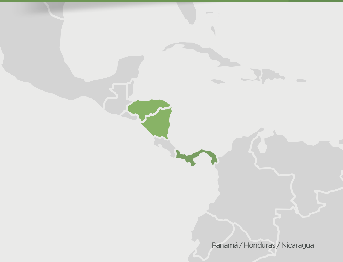
Panamá / Honduras / Nicaragua