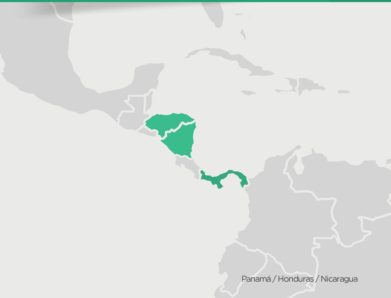
Panamá / Honduras / Nicaragua